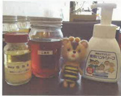
ハンドソープ、油のピン