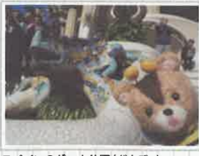
スペインのグエル公園(ガウディ)