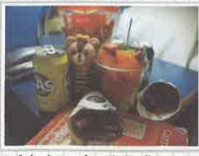
スペインのスーパーで買った物